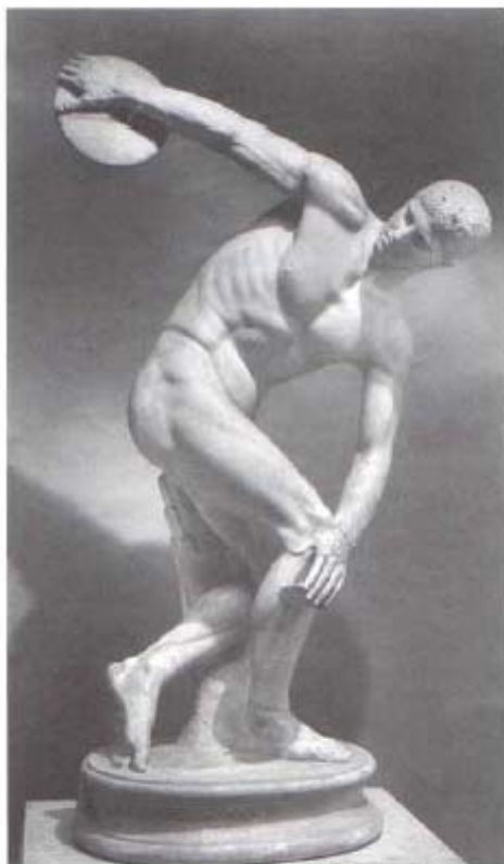
Myron, Dyskobol (kopia) Muzeum Narodowe w Rzymie

Zawodnik obsypywał dysk piaskiem dla łatwiejszego chwytu. Potem wbiegał do balbis, wykonywał obrót i wyrzucał dysk w powietrze. Długość rzutu oznaczano strzałką wbitą w piasek.