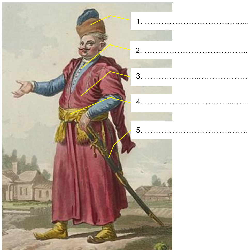
Jean Pierre Norblin, Szlachcic polski , Gabinet Rycin Biblioteki Uniwersytetu Warszawskiego; pl.wikipedia.org

W wykropkowane miejsca 1–5 wpisz nazwy części stroju ukazanego na poniższym portrecie Sarmaty. Określenia wybierz z tekstu 1.