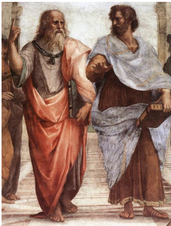
Rafaël Santi, Szkoła ateńska (fragment), 1509 – 1511, Stanze della Segnatura, Watykan

Poniżej znajduje się fragment słynnego malowidła ściennego Rafaela z początku XVI w. Szkoła ateńska . W centrum malowidła artysta umieścił dwóch najsłynniejszych filozofów starożytności: Platona i Arystotelesa.