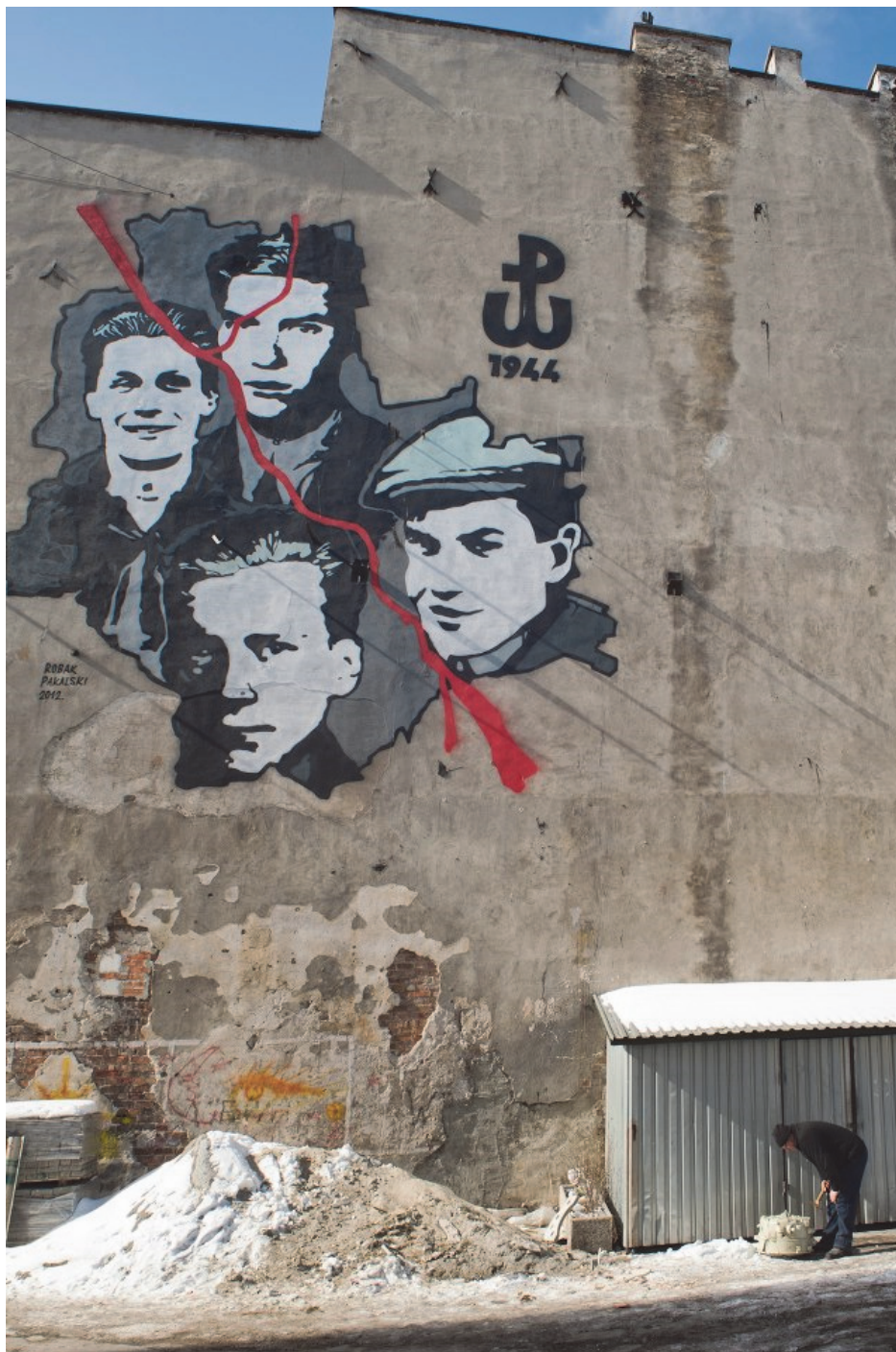
Fotografia 1. MURAL POWSTANIE WARSZAWSKIE 1944