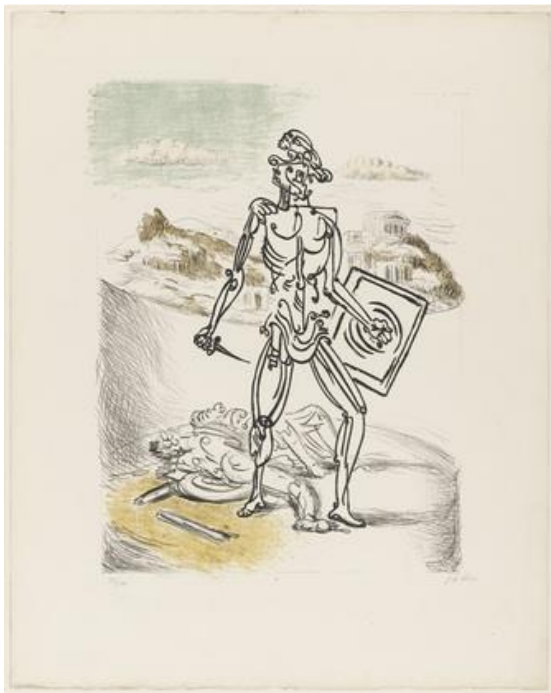
Ilustracja 3. Giorgio de Chirico Gladiator . Załącznik do zadania dla grupy II