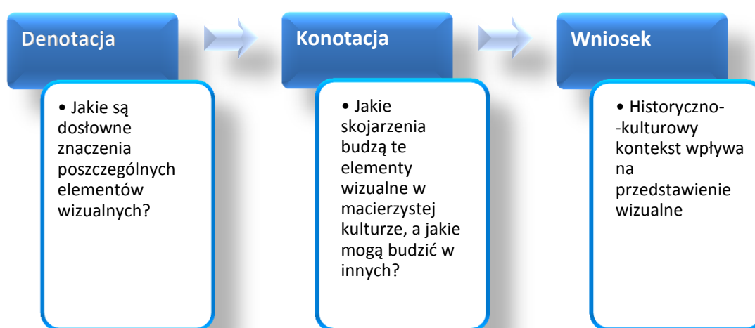
Rys. 1. Schemat zależności denotacji i konotacji (opracowanie własne)

Związek znaku i znaczenia nie zawsze jest precyzyjnie określony. W systemie denotacyjnym odnosi się do znaczenia dosłownego, wspólnego w danej kulturze. Ale w systemach konotacyjnych użytkownicy znaków na podstawie własnych skojarzeń odnoszą się do sekwencji znaków (syntagm), innych kodów i szerszych kontekstów kulturowych. Mapy znaczeń okazują się tylko skojarzeniami, uwarunkowanymi kulturą i potwierdzonymi przez osobnicze spostrzeżenia (por. rysunek 1).