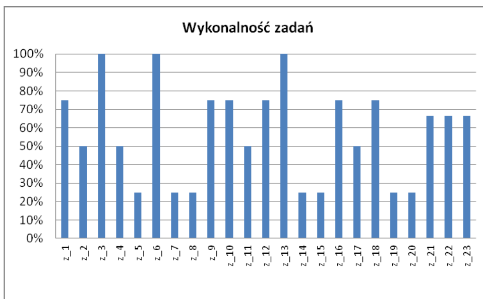
Rysunek 4. Przykładowy wykres wskaźników wykonalności zadań