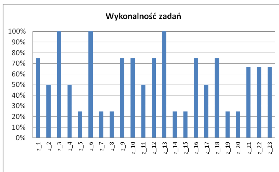
Rysunek 4. Przykładowy wykres wskaźników wykonalności zadań