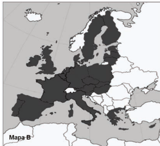
Mapa B. ....