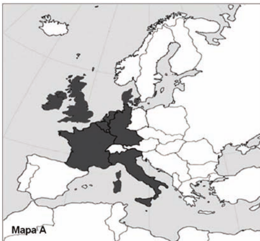
Mapa A. ....

Mapy przedstawiają proces rozwoju terytorialnego Unii (Wspólnot) Europejskiej. Do zamieszczonych map dobierz odpowiadające im tytuły. W wyznaczone miejsca wpisz właściwe numery.